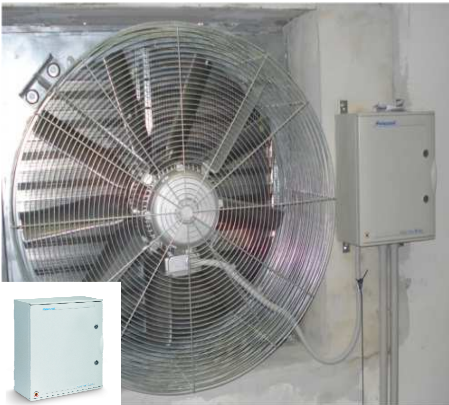
Serie TAIS TRE

Il cementificio offre un'ampia gamma di leganti idraulici, sia di tipo Portland che Pozzolatici, garantendo i migliori risultati in tutti i campi di applicazione, per poter soddisfare le diverse esigenze che il mercato richiede.