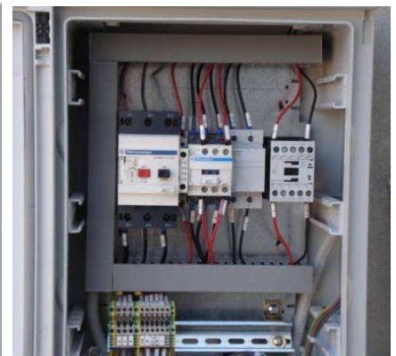
Circuito interno al quadro