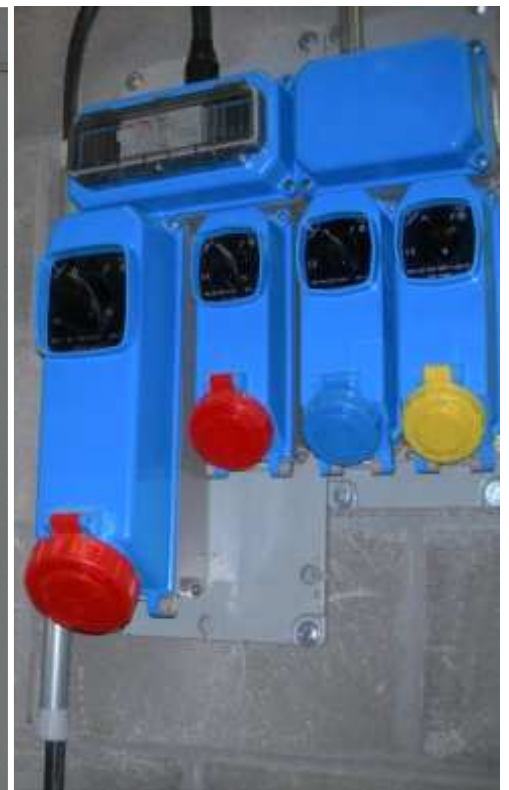
Alimentazione tela formatrice