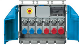
QUADRI DI PIANO / ZONA