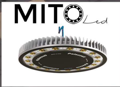
MIVE è illuminata da 12 MITO LED a sospensione da 17.640 lm