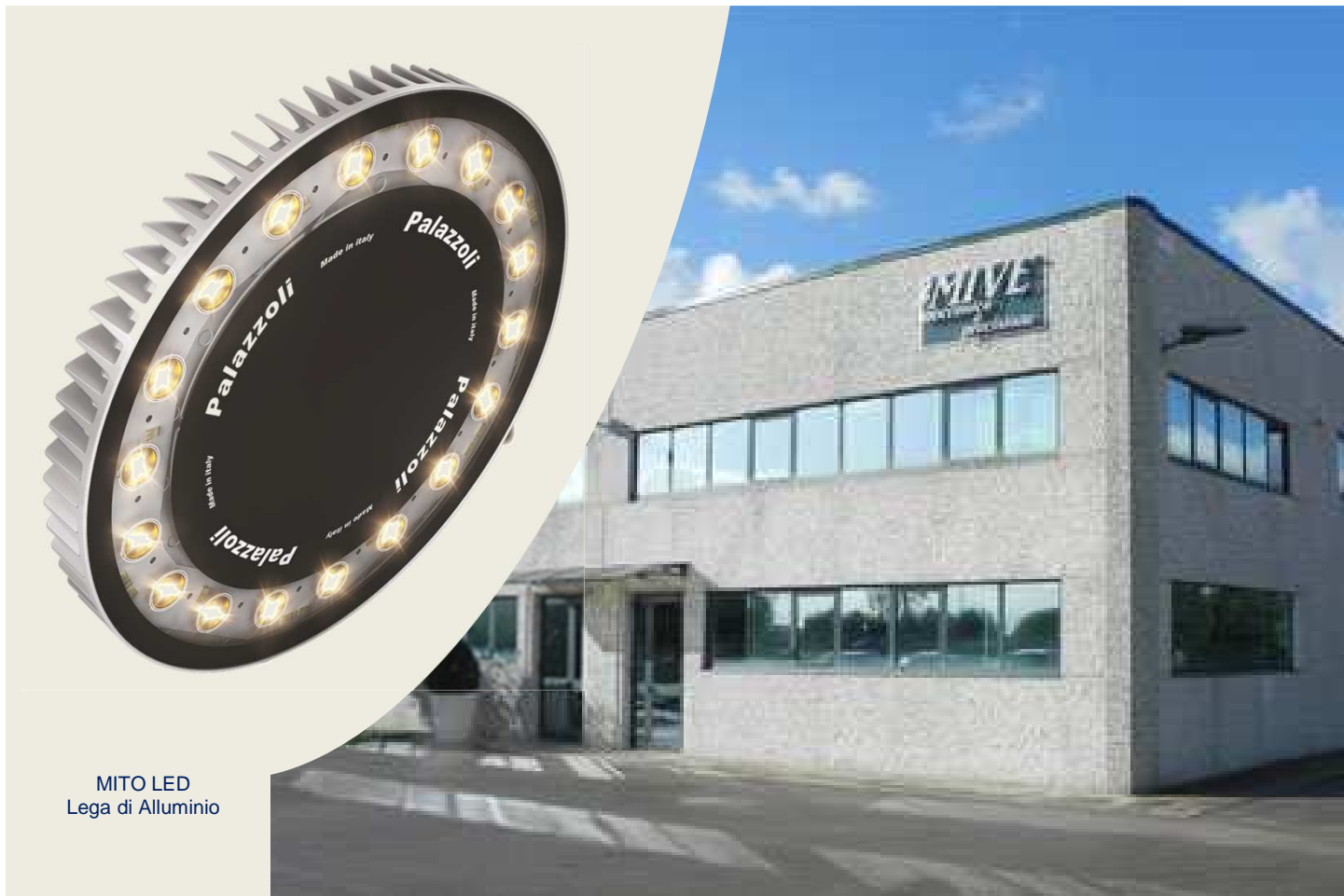
MITO LED Lega di Alluminio

La MIVE è un'officina meccanica di precisione, leader nella tornitura , fresatura e C.N.C, con una esperienza ultra trentennale nella costruzione di componenti per l'industria clinico-farmaceutica, biotecnologica, aeronautica ed alimentare.