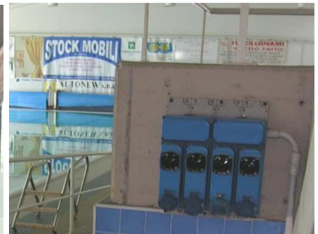
Sala per acqua bike