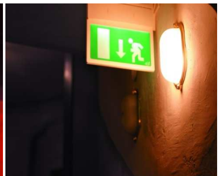
Corridoi e scale